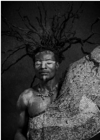
Prince Toffa - Plasticien, Costumier. Bénin.

Son art de l'upcycling s'exprime à travers des performances stupéfiantes et des toiles étonnantes. Il puise ses matières premières dans le recyclage du plastique et des pétales métalliques qu'il découpe dans des canettes de boisson.